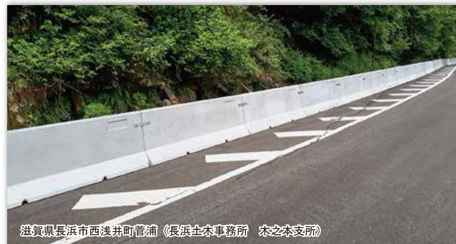
道路法面の崩落 土砂止めに使用