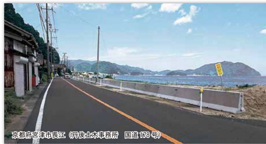
海岸道路の砂の 飛散防止に使用